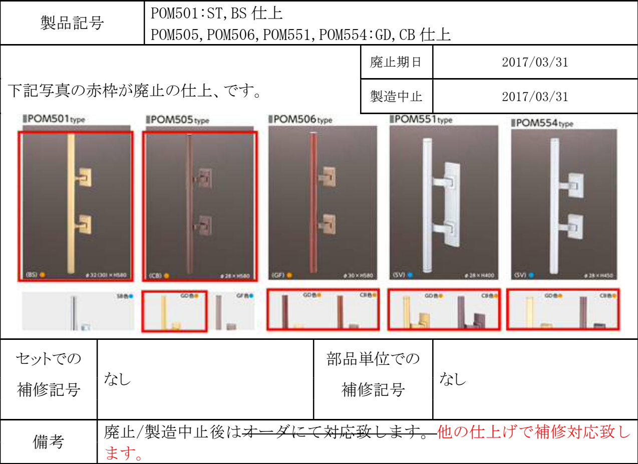
POM500シリーズの切込外観図