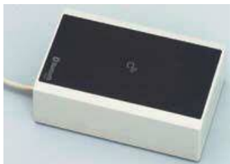
BLE 登録リーダ 外観